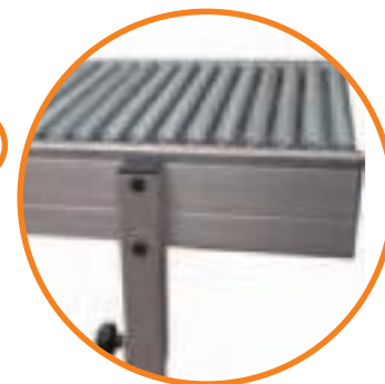
Detail: Roller Conveyor Dettaglio: Rulliera